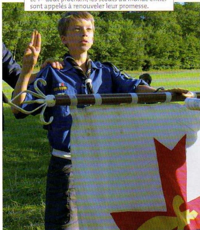
J.-M. Audirac / AGSE

Le 1 er août prochain, les scouts du monde entier sont appelés à renouveler leur promesse.