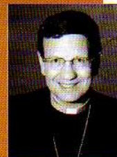
Alain Elorza / Ctrc

Il faut rendre hommage aux pionniers, aux initiateurs. Dans les années vingt, ce mouvement a volontairement été développé en France par des hommes et des prêtres qui ont reconnu dans la méthode de Baden Powell – responsabilité des jeunes en fonction de l'âge, amour de la nature, vie en groupe... – une éducation à l'Évangile. Je crois que cette intuition reste valable aujourd'hui. Les pédagogies ont su s'adapter et évoluer au rythme de la société en laissant place à une véritable dynamique de projet. La formation des chefs et cheftaines est également un point d'effort des mouvements où se jouent une belle transmission des responsabilités.